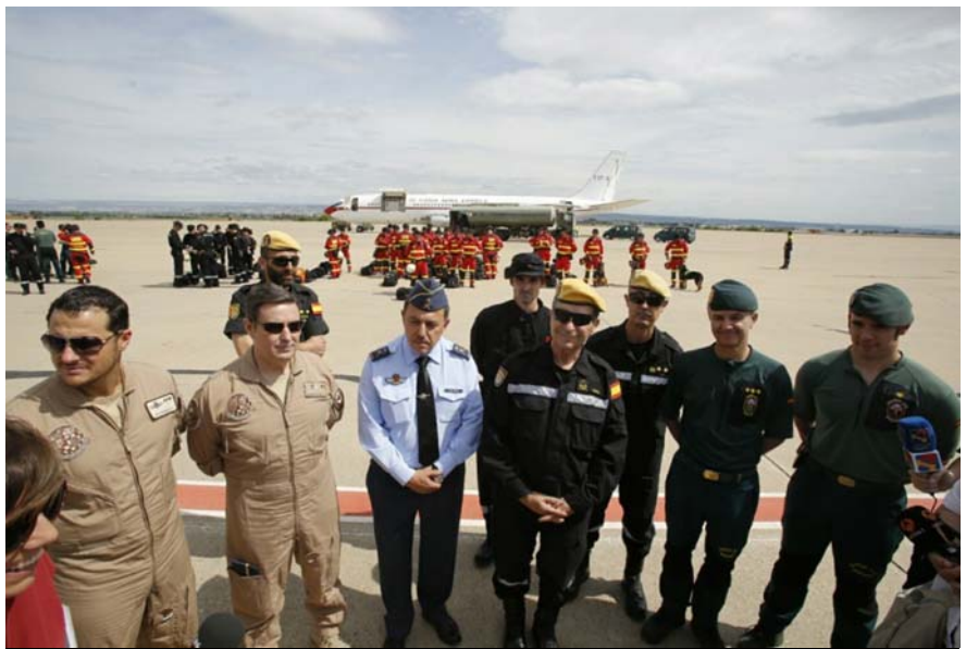
La misión de rescate, preparada para salir de la Base Aérea de Zaragoza G.

Los militares de la UME y los miembros del Grupo de Montaña de la Guardia Civil que participarán en el operativo de búsqueda de los españoles desaparecidos en Nepal tras el terremoto partieron este sábado, pasadas las 13.00, de la Base Aérea de Zaragoza , con destino al país asiático. Un Boeing 707 del Ejército del Aire traslada a Nepal a 47 componentes de la Unidad Militar de Emergencias (UME), siete especialistas en montaña de la Guardia Civil y cinco perros rastreadores.