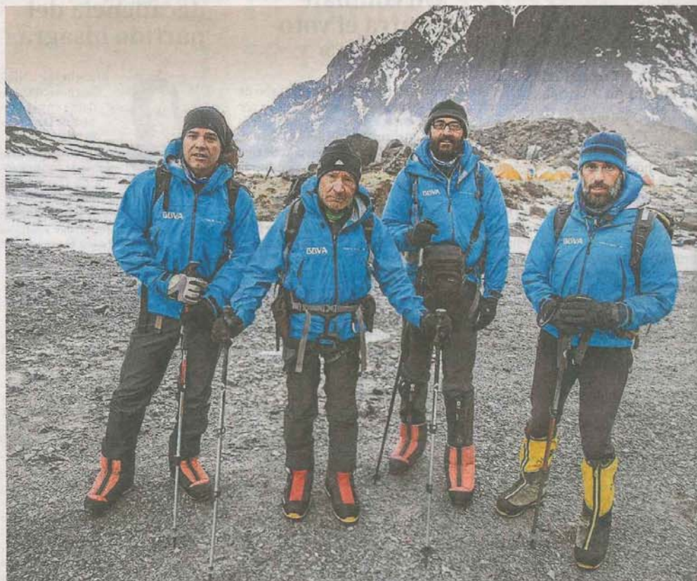
Cuatro montañeros españoles de una expedición, rescatados y ya a salvo en Katmandú

El reto al que se enfrentan es titánico porque dicho valle, a unos 4.000 metros de altitud, ha quedado arrasado por los corrimientos de tierra que provocó el terremoto. «Es como si hubiera caído allí una bomba atómica; una ladera se ha derrumbado por completo y otra parece haber sufrido su onda expansiva», detalló el teniente coronel Fernando Olalde, agregado militar de la Embajada española en la India. A bordo de un helicóptero, Olalde sobrevoló ayer el lugar para comprobar su grado de destrucción y buscar el