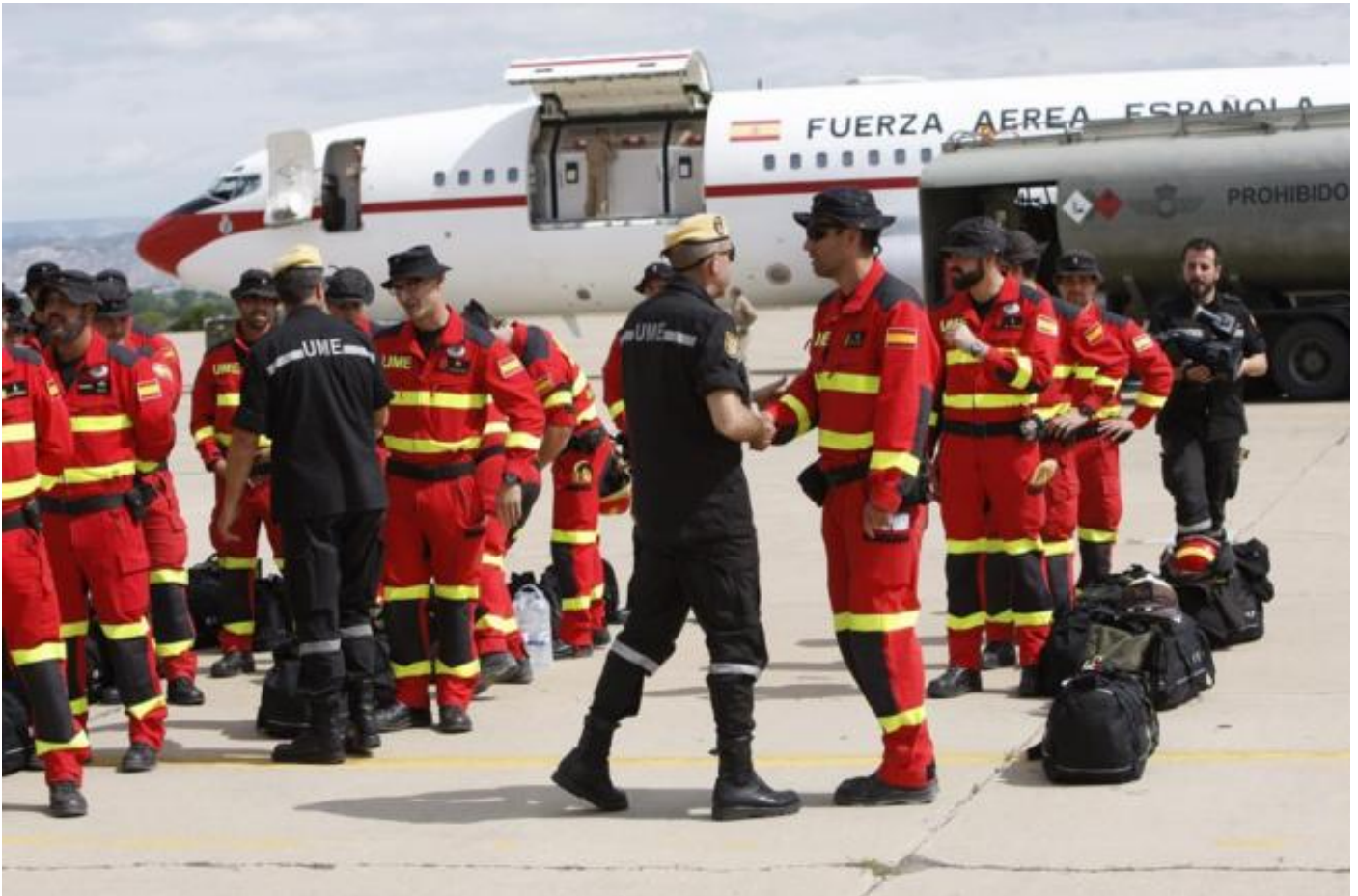
Militares de la UME y miembros del equipo de Montaña de la Guardia Civil, antes de salir para Nepal.

VÍCTOR M. OLAZÁBAL Especial para EL MUNDO Katmandú