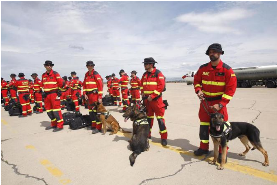
Militares de la UME y los miembros del Grupo de Montaña de la Guardia Civil que participarán en el operativo de búsqueda.

Además de cuarenta componentes de la Unidad Militar de Emergencias, ha viajado hasta Katmandú un experto en catástrofes y cinco perros rastreadores.