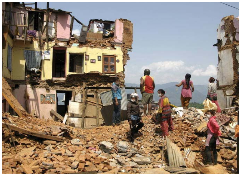
Varios habitantes de Katmandú, buscan entre los escombros de las viviendas derruidas tras el terremoto de 7,8 grados, que sacudió el pasado día 26 Nepal.

La embajadora de la Unión Europea en Nepal, Rensje Teerink, afirmó el viernes que entre los fallecidos se encuentran doce ciudadanos europeos y que unos 1.000 continúan sin ser localizados, aunque "podrían encontrarse bien".