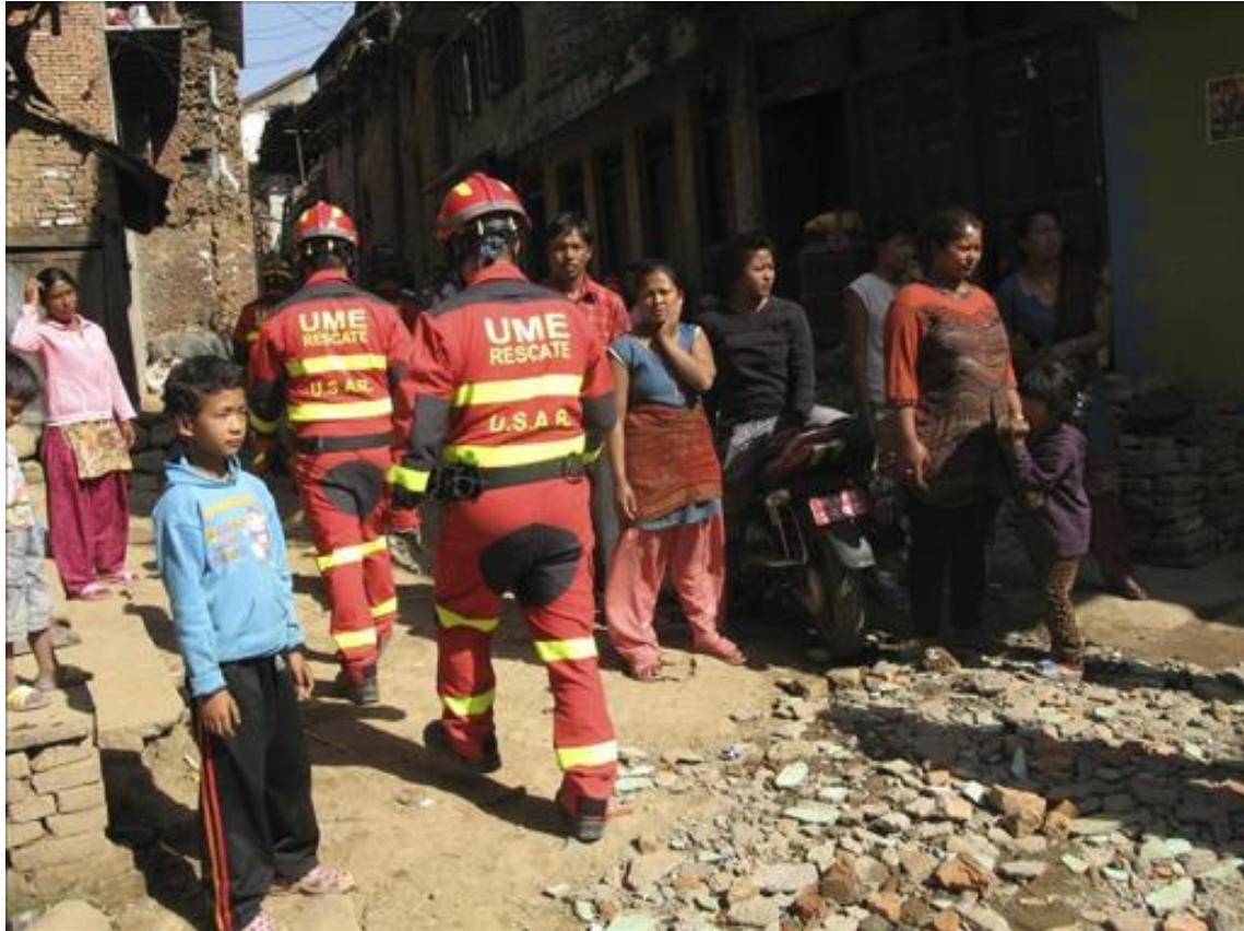
Agencia EFE - Miembros de la Unidad Militar de Emergencias (UME) de España se despliega en Chapagaun, al sur de Katmandú, para ayudar en las labores de recuperación tras el terremoto en Nepal. EFE

Katmandú, 5 may (EFE).- El terremoto que golpeó Nepal acabó con la vida de miles de personas, destruyó parte de su patrimonio cultural y asestó un duro golpe a uno de los principales motores económicos del país: el turismo.