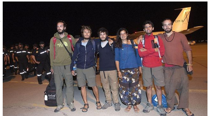
Los últimos repatriados que han aterrizado en la B.A de Zaragoza

El avión militar Boeing 707 en el que han regresado los 47 efectivos de la Unidad Militar de Emergencias (UME) y los doce guardias civiles desplazados a Nepal tras el terremoto ha aterrizado en la base aérea de Zaragoza hacia las once y cuarto de la noche del lunes. A Zaragoza, también han llegado esta noche siete personas repatriadas, de las que cinco son españoles y dos son argentinos .