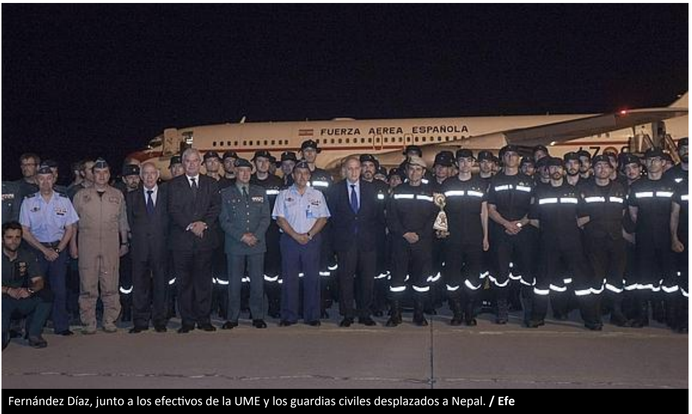
Fernández Díaz, junto a los efectivos de la UME y los guardias civiles desplazados a Nepal.

El ministro del Interior ha recibido en la Base Aérea de Zaragoza al avión militar Boeing 707 en el que han regresado los 47 efectivos de la Unidad Militar de Emergencias y los doce guardias civiles desplazados