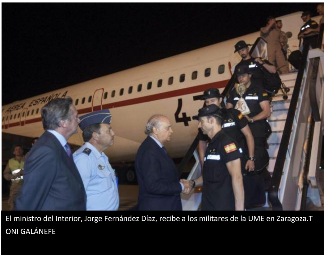
El ministro del Interior, Jorge Fernández Díaz, recibe a los militares de la UME en Zaragoza.

El ministro del Interior, Jorge Fernández Díaz , ha afirmado hoy que "se ha hecho todo lo humanamente posible" por los españoles que estaban en Nepal cuando se produjo el terremoto, una catástrofe de gran magnitud , en la que se han registrado miles de muertos y heridos.